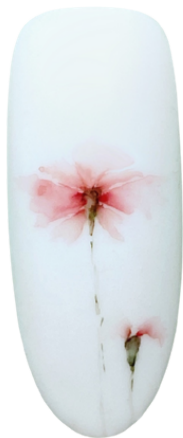
Fot. Układ wertykalny

Elementy zdobienia rozłożone są tutaj pionowo, jest to układ będący dokładnym przeciwieństwem układu horyzontalnego (poziomego). Ten układ jest uniwersalny, można go zastosować na każdym rodzaju płytki paznokcia.