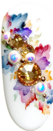
Fot. Układ diagonalny

W układzie diagonalnym elementy są rozłożone po skosie, lub można zaobserwować znaczną przewagę.